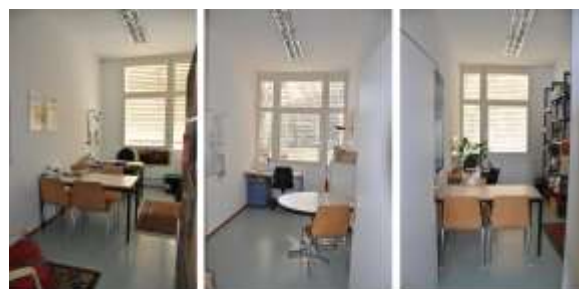
UFFICI SOSTEGNO PEDAGOGICO

Ha lo scopo di assicurare, integrando l'attività educativa del docente titolare, un adeguato aiuto agli allievi in difficoltà. I docenti di sostegno pedagogico svolgono quindi opera di prevenzione al disadattamento scolastico, stabilendo contatti e collaborazioni all'interno dell'istituto e promuovendo, in accordo con il Cdd, iniziative e interventi volti a sostenere gli allievi nelle loro attività di apprendimento e nell'adattamento alla vita scolastica.